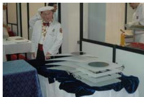
I concorrenti stupiti dalle basi curiosano...