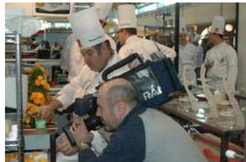
La RAI riprende alcune fasi della gara