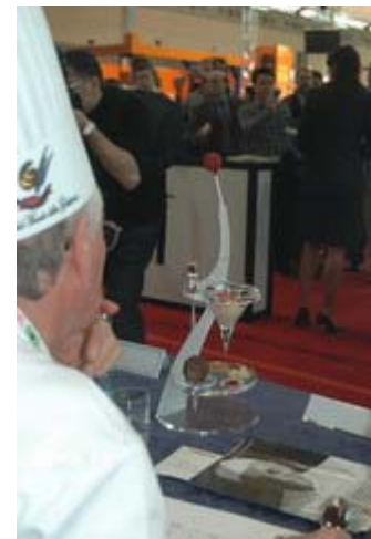
La giuria rimane sorpresa dall'inusualità della presentazione