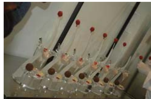
Le coppe vengono decorate con il gelato