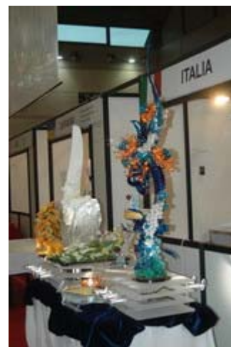
Elaborati in mostra