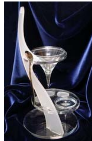
La coppa prima di essere usata per il gelato

Complimenti vivissimi soprattutto a loro che grazie al loro impegno hanno permesso lo svolgersi della manifestazione.