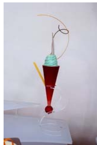
Cono e Portacono