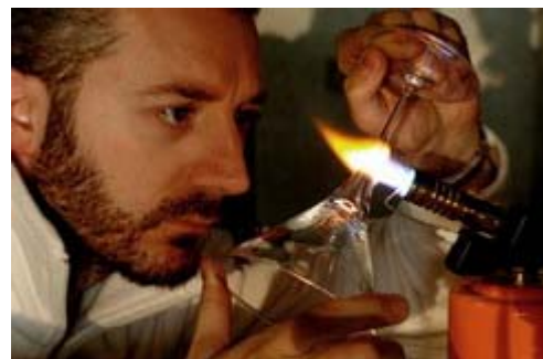
Barichella impegnato nel taglio del bicchiere