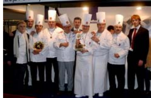
La Squadra e gli organizzatori

La manifestazione ha avuto luogo al SIGEP di Rimini, e ha visto la partecipazione di 10 squadre internazionali: Argentina, Brasile, Francia, Polonia, Repubblica Ceca, Ungheria, Italia, Stati Uniti d'America, Marocco, Ukraina.