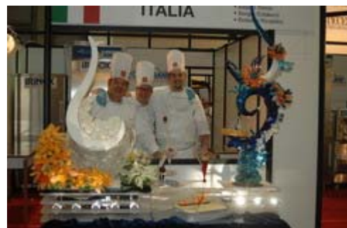
La squadra presenta il proprio lavoro sui supporti di Barichella