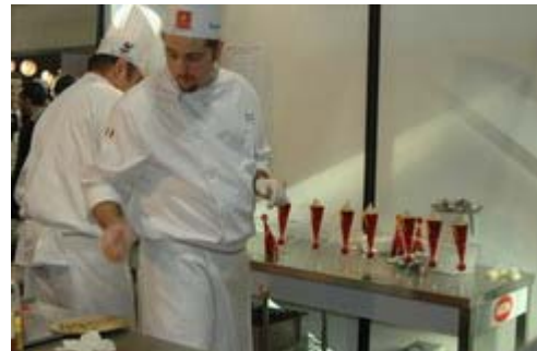
Assemblaggio dei coni