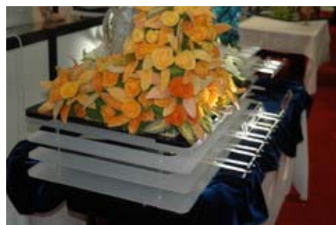
Basamento porta scultura con fibre ottiche e specchi