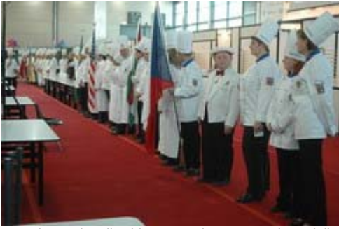
Le nazionali schierate per la presentazione delle squadre